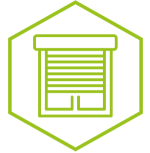
Redőny és szúnyogháló