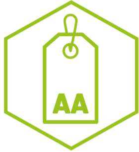
AA energetikai besorolás